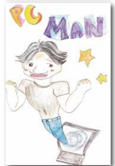
さりーちゃん <シャローム浦和>