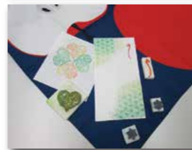
みるみるさん <シャローム浦和>

昨年8月に誕生した甥っ子が健やかでありますように願いをこめて縁起の良い麻の葉模様を消しゴムハンコで作りました。<作者プロフィール>茨城県生まれ。通院と通所のお陰で安定した生活を送り、ありのままの自分でいられることに幸せを感じている。